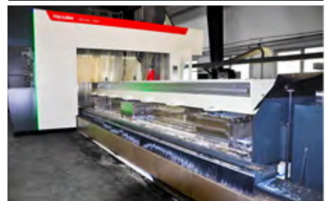
FRF 300/10, Tschechische Republik